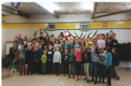
Le Père Noël au restaurant périscolaire