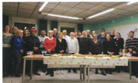
Pot de fin d'année pour le Conseil Municipal et le personnel avec remise de cadeaux