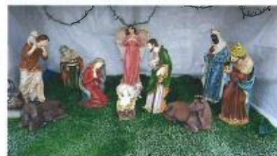
Vu dans un jardin solgnois