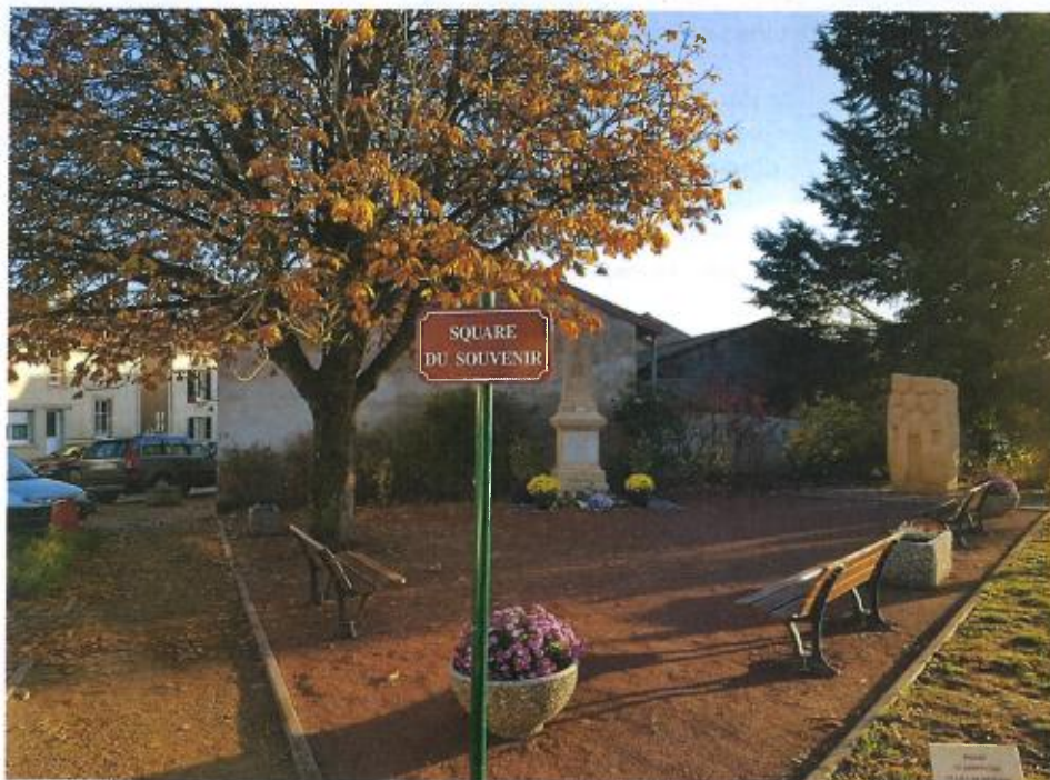
Square du souvenir emplacement à respecter