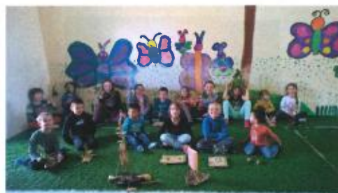
Les enfants du périscolaire en pleine activités ludiques et au château de Manderen